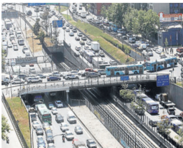
►► Tráfico vehicular en Santiago.